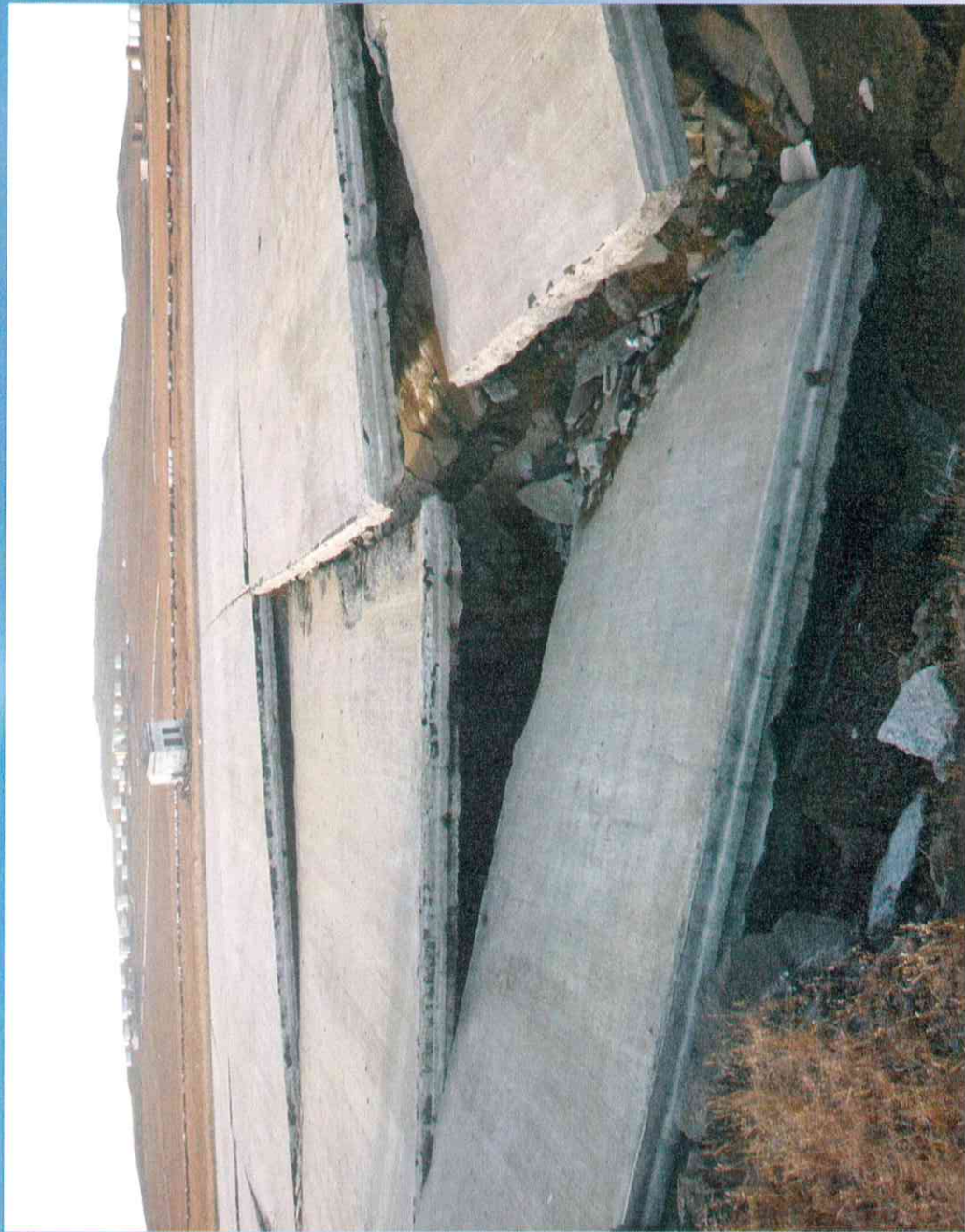
Растепление и вымывание основания покрытия РД